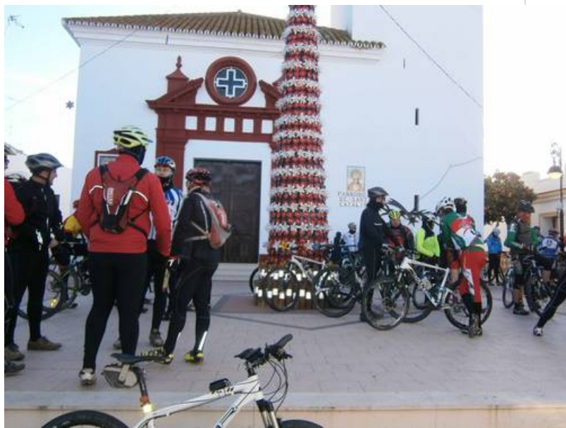
( http://www.beturia.es/export/sites/beturia/es/proyectos-y-actividades/tag/.galleries/noticias-tag/2013-12-27-Ruta-Cicloturistica3.jpg )