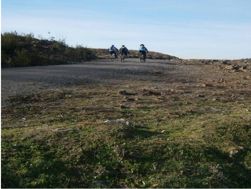
( http://www.beturia.es/export/sites/beturia/es/proyectos-y-actividades/tag/.galleries/noticias-tag/2013-12-27-Ruta-Cicloturistica2.jpg )